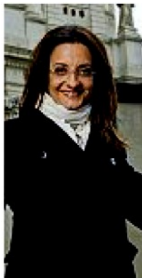
La scrittrice Catena Fiorello